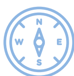
Sidorna Ethics and Compliance på Pulse